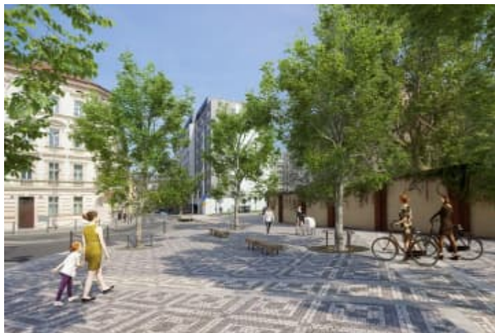
Biskupcova (v úseku mez Zelenky Hajskeho a J. Zelivskeho)