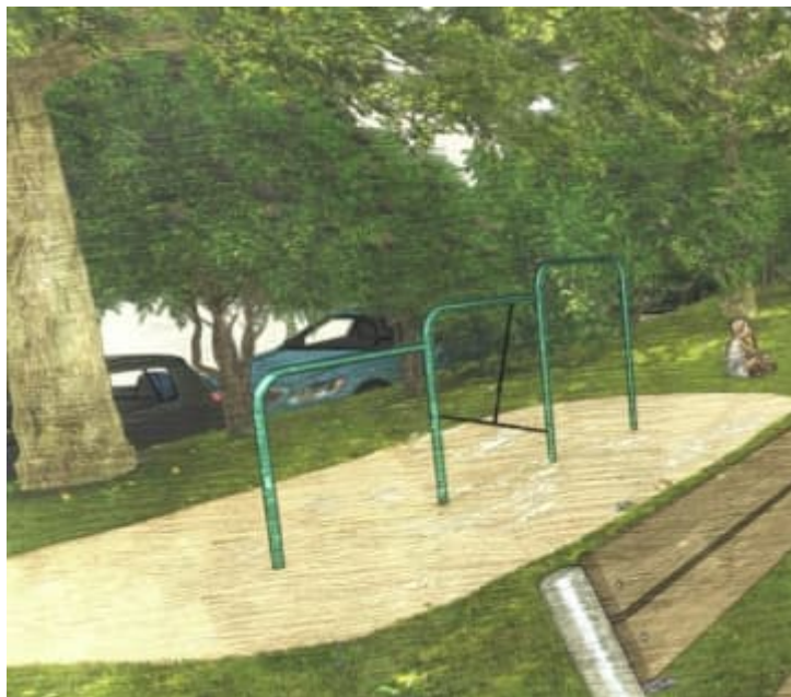
Trojhrzdí, které ustoupilo kolotoči.

Úprava herních prvků by měla být realizována do konce roku 2023, přičemž hřiště bude z tohoto důvodu uzavřeno maximálně jeden měsíc.